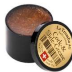
La Tromba Zugfett