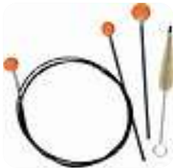
Stofftaschentuch für Innen