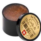
La Tromba Korkfett