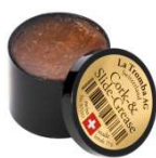
La Tromba Korkfett