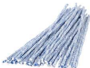
Tonloch- oder Pfeifenreinige